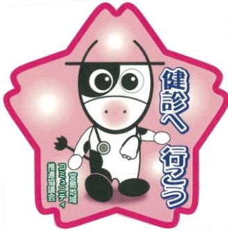
↑今回配布している マグネット

宮島支所市民福祉担当課長より宮島地域コミュニティ推進協議会へ「健診受診率向上キャンペーン事業委託」について提案があり、当協議会として受託することを決定し、7月1日の合同部会で報告をしました。